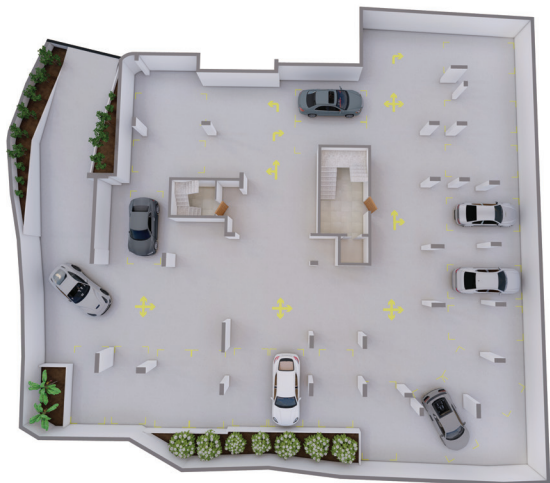
شقة A 180 m 2 | ترس | 62 m 2