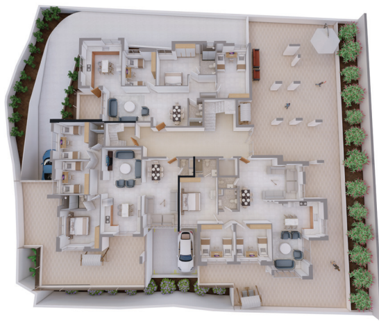
شقة B 170 m 2